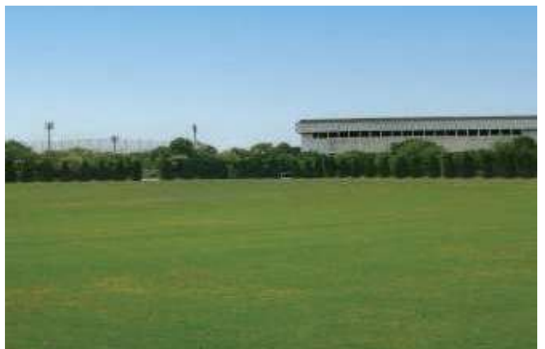
水島緑地福田公園 サッカー・ラグビー場（人工芝）

人工芝化によって利用環境が向上した一方で、夜間利用ができないという現場の課題を踏まえ、昨年9月議会で屋外照明の整備を提案しました。今回、予算が計上されたことで、スポーツに取り組む子どもたちや利用団体の活動の幅が広がるとともに、大会開催や合宿誘致など、地域のにぎわい創出にもつながるものと期待しています。今後は、供用開始に向けた着実な整備とともに、周辺環境への配慮を行いながら、より使いやすいスポーツ環境の充実を求めています。