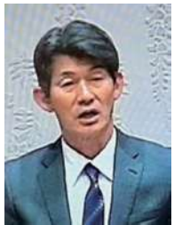
別府 文化産業局長

夜間利用が可能となり、練習環境の向上や大会開催、合宿誘致などにつながると考えています。照明はLEDを採用し、省エネと周辺環境への配慮も行います。