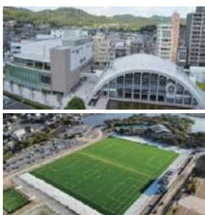
児島市民交流センター